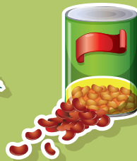
FRIJOLE Y LEGUMBRES