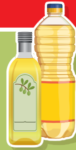
ACEITES VEGETALES NO TROPICALES