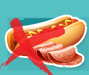
CARNES GRASAS O PROCESADAS – Elija mejor carnes magras o extra magras