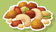
NUECES Y SEMILLAS