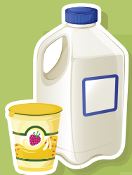
LÁCTEOS BAJOS EN GRASA Y SIN GRASA